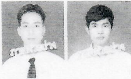
นักศีกษาชาย

1.3 ให้นักศีกษาทำการ Upload ไฟล์รูปถ่ายสีหน้าตรง สวมเสื้อเชิตสีขาวเท่านั้น (ห้ามสวมชุดของสถาบันเดิม) ขนาดไฟล์ไม่เกิน 100k