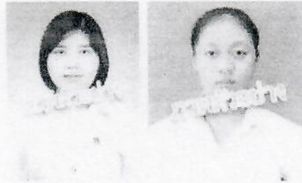
นักศีกษาหญิง